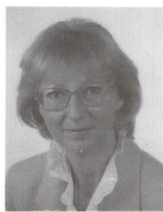
LRSD Birgit Rauch , Dezernentin bei der Bezirks- regierung Köln