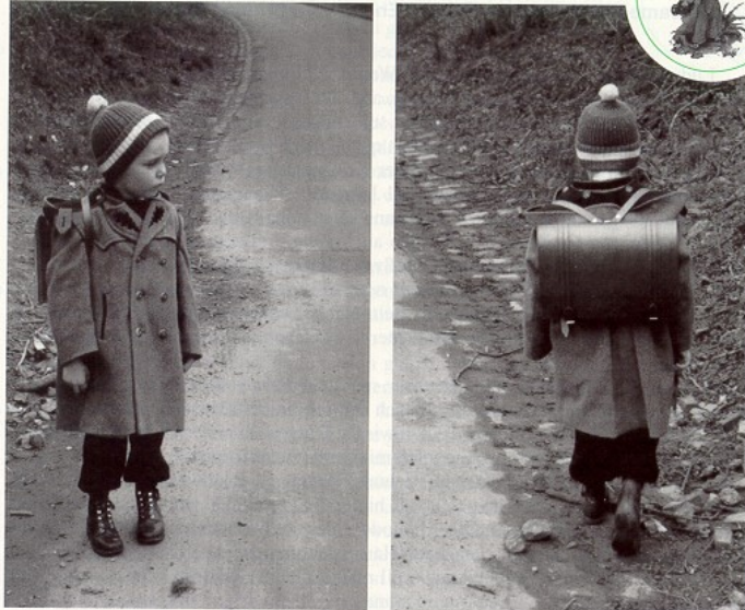
Erster Schultag, Ostern 1958

Die Arbeitsaufgaben zu diesen Fotos lauteten: